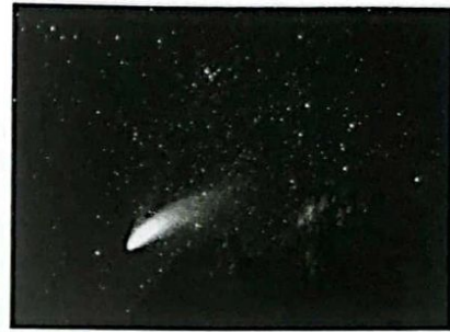
Figure 1 : Comète de Hale-Bopp

Les divers peuples du monde connaissent les comètes depuis bien longtemps. Les comètes apparaissent dans le ciel, leur brillance augmentant progressivement en quelques mois en révélant une majestueuse structure formée d'une tête brillante, appelée chevelure ou coma, suivie d'une longue traîne lumineuse (figure 1). Les comètes s'affaiblissent ensuite progressivement et disparaissent en plusieurs mois.